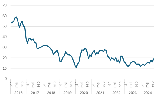
Afbeelding: ontwikkeling bezorgers met WW-uitkering Gooi en Vechtstreek, 2018-heden

Vooraf vlak na de coronaperiode steeg de vraag naar bezorgers. In de eerste helft van 2024 zien we dat de vraag wat afneemt, maar dat lijkt in lijn met dezelfde perioden in 2022 en 2023. Toen steeg de vraag met de naderende feestdagen ook in het derde en vierde kwartaal.